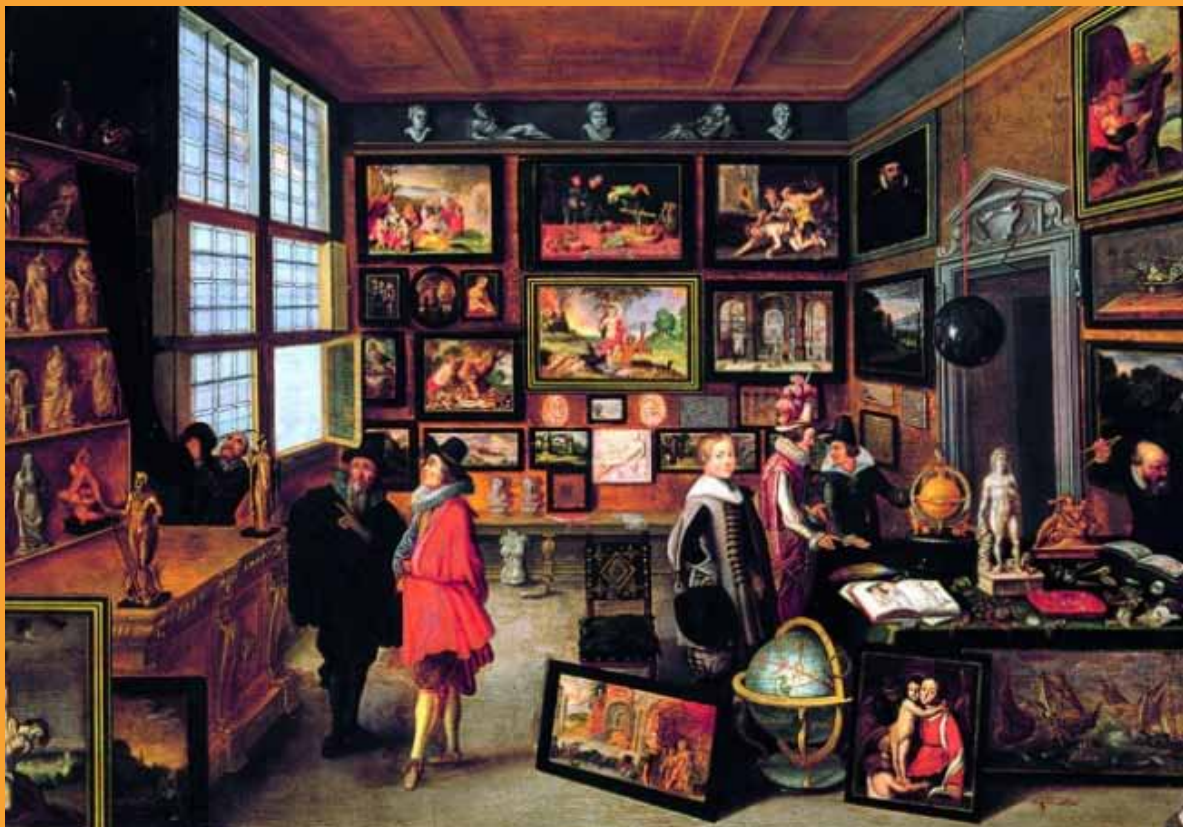
Cabinet d'amateur de Cornelis de Baellieur (1637)