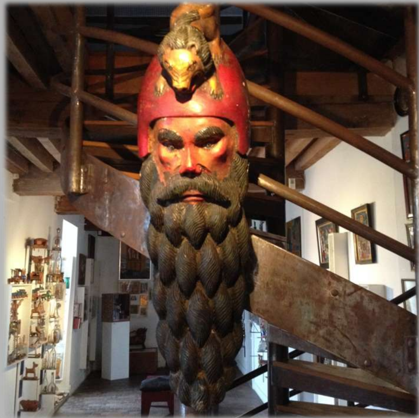
Masque mexicain peint, sculpté en bois léger datant du XXème siècle et représentant la tête d'une homme surmonté d'une lionne.